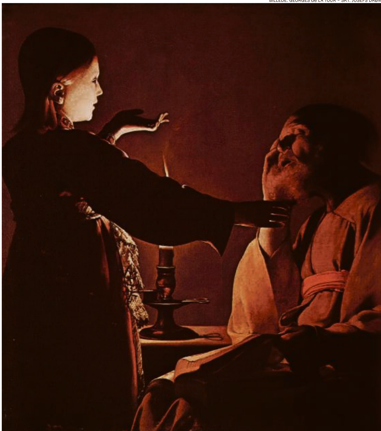
Når Myrkr holder mørkninger som performances rundtomkring i landet, er det også tydeligt, at de ældre i publikummet har meget lettere ved at falde ind i stilheden og roen og blive nærmest meditative, mens de yngre ofte har det svært med ren stilhed.

Ude på havnen går lydcollagen over i musik: et værk af vokalgruppen IKI, optaget i mørke. Man vandrer sammen, men i hver sin lille verden, og i de dunkle omgivelser bliver oplevelsen af både musik og stemmer intens og inderlig. Efter en times lyttende vandring på havnen og i det aftenstille kvarter tæt ved når gruppen tilbage til udgangspunktet. Nogle gange tænder Myrkr bål som afslutning, men i aftenens støvregn tilbød man i stedet stilfærdigt deltagerne at skrive et postkort om deres oplevelse til en fremtidig